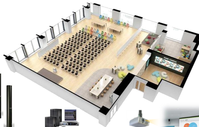
減衰率しない ラインアレイスピーカ