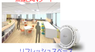
リフレッシュスペース BGM設備