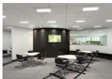
ミーティングブース デジタルサイネージ