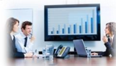
テーブル&モニター ワイヤレスによる映像伝送