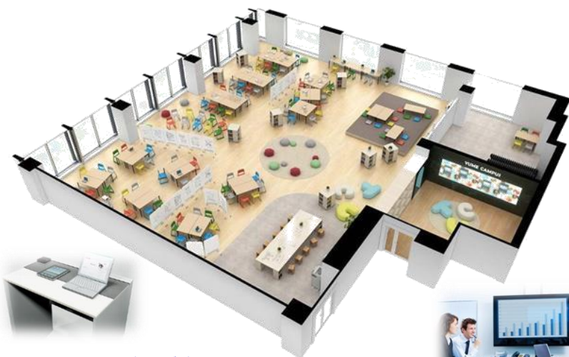
フリーアドレス・スタンディングデスク 無線LANシート

執務室・ミーティング・リフレッシュなど あらゆるゾーンでのおもいおもいに利用できる