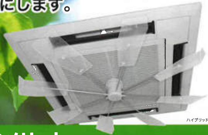
ハイブリッド・ファンFJR